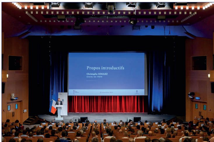
Cérémonie d'ouverture des 3 sessions nationales et 4 cycles

Séminaire conjoint organisé avec l'Ecole supérieure des forces de sécu- rité intérieure (ESFSI) tunisienne portant sur le ma- nagement stratégique des crises