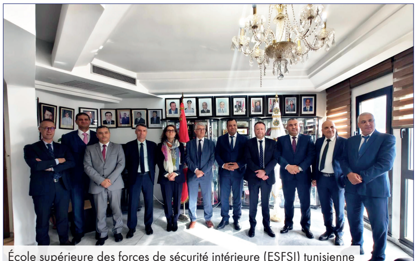
École supérieure des forces de sécurité intérieure (ESFSI) tunisienne